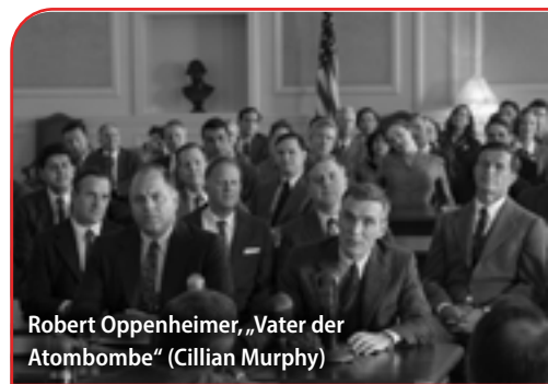
Robert Oppenheimer, „Vater der Atombombe“ (Cillian Murphy)

Das von Christopher Nolan geschriebene und inszenierte Thriller-Epos „Oppenheimer“ konfrontiert das Publikum mit dem pulsie-