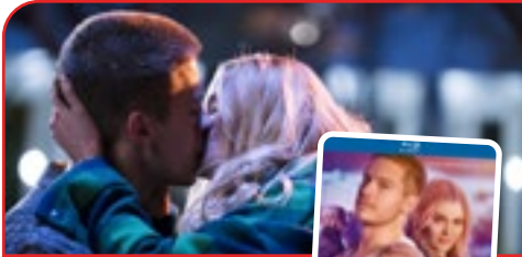
Abby Abernathy (Virginia Gardner) und Travis Maddox (Dylan Sprouse)