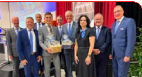
Zufriedene Gesichter: Die Mitglieder im Aufsichtsrat der Raiffeisenbank Neustadt