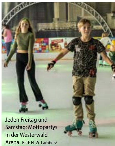
Jeden Freitag und Samstag: Mottopartys in der Westerwald Arena

Zum Servieren die Mascarpone-Lebkuchen-Creme auf Gläser verteilen. Erst die Schokolade, dann den Karamell mit einem Löffel unterziehen und mit den Amarettini-Bröseln garnieren. Guten Appetit!