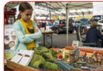
Mit dem Ziel, den Nachwuchs für den Modellbau zu begeistern, nahmen die Eisenbahnfreunde auch am Unkeler Tag der Vereine teil.

Daher steht die Jugendarbeit auch ganz oben auf der Liste der Eisenbahnfreunde Wied-Rhein. Vor allem bei den Tausch- und Verkaufsbörsen sollen besonders die jungen Besucher angesprochen und ausgelotet werden, ob es Interesse für eine Modelleisenbahn-Jugendgruppe gibt. Nächste Gelegenheit dafür bietet die Adventsbörse der Eisenbahner am 10. Dezember im Bürgerhaus Heister. | fu