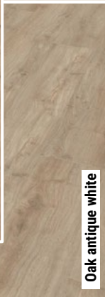
Oak antique white