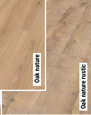
Oak nature rustic