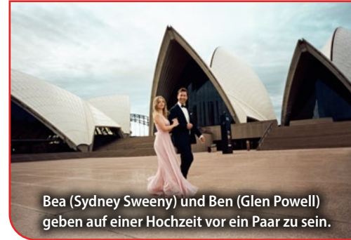
Bea (Sydney Sweeney) und Ben (Glen Powell) geben auf einer Hochzeit vor ein Paar zu sein.

Bea und Ben wirken wie das perfekte Paar. Beim ersten Daten knistert es bereits gewaltig und es scheint, als könnte sich zwischen den beiden noch viel mehr entwickeln. Doch nach diesem verheißungsvollen Start geschieht etwas, das ihre glühend heiße Anziehungskraft zu Eis erstarren lässt. Der Traum von einer gemeinsamen Zukunft ist damit erstmal vom Tisch. Doch das Schicksal hat andere Pläne und lässt die beiden unerwartet wieder aufeinander treffen: als