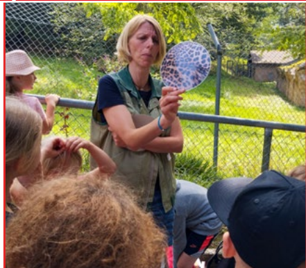
„Leise Pfoten, scharfe Zähne“: Bei einer Führung im Zoo Neuwied gab es spannende Informationen über Raubkatzen.