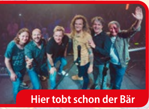
Hier tobt schon der Bär

Während es die Rheinschiene karnevalistisch noch ruhig angehen lässt, tobt im Westerwald und insbesondere im Siebengebirge schon der Bär. Nach der „Jeck is jeil“-Sause (siehe unten) steht mit „Jlilienberch Alaaf!“ im Bürgerhaus Aegidienberg schon der nächste närrische Höhepunkt an. Tickets für die Sitzung, in deren Rahmen unter anderem die Bläck Fööss (Foto) und Et Klimpermännchen auftreten, gibt es online auf www.klaevbotz.de