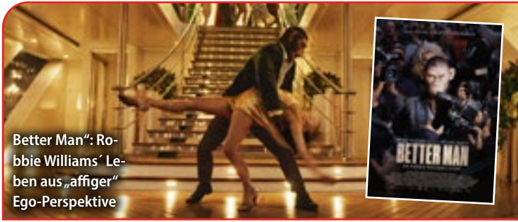
Better Man": Robbie Williams' Leben aus „affiger“ Ego-Perspektive

Jetzt: „Better Man – Die Robbie Williams Story“