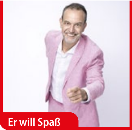
Er will Spaß