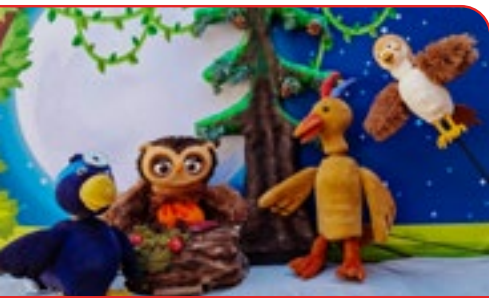
Die „Eule mit der Beule“ und ihre Freunde: Figurentheater für Kinder ab drei Jahren Bild: C. Sperlich