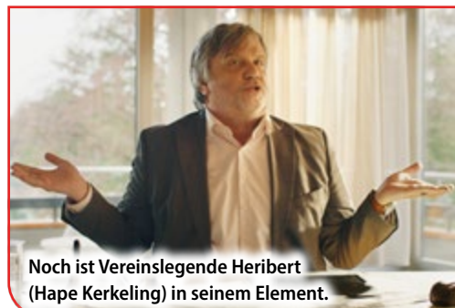
Noch ist Vereinslegende Heribert (Hape Kerkeling) in seinem Element.

Eigentlich ist es reine Formsache: Heribert, langjähriger Vorsitzender des Tennisclubs Lengenheide, und sein ehrgeiziger Stellvertreter Matthias wollen nur über die Anschaffung eines Grills für die nächste Vereinsfeier abstimmen lassen. Als dann aber vorgeschlagen wird, für Erol, dem einzigen muslimischen Mitglied, einen zweiten Grill