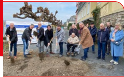
Der erste Spatenstich ist erfolgt: Die Rheinpromenade wird saniert.