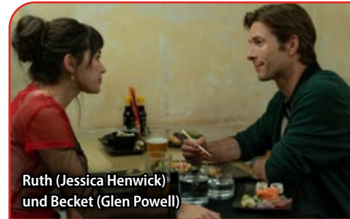
Ruth (Jessica Henwick) und Becket (Glen Powell)

Becket ist charmant und ehrgeizig, aber ohne das Vermögen, das ihm aus seiner Sicht nach dem Tod seiner Mutter zusteht. Und so beschließt er, sich das Erbe zurückzuholen – indem er die sieben Verwandten beseitigt, die ihm dabei im Weg stehen. Während sich die „Unfälle“ in der Familie häufen, gerät